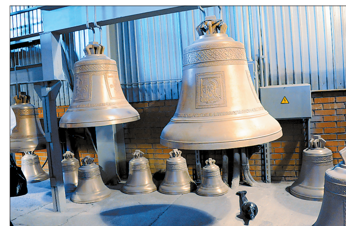
Сегодня число храмов, поющих голосами каменских колоколов, перевалило за тысячу. В день, когда мы приехали на завод, ушла партия на Украину, а незадолго до этого – в Тибет